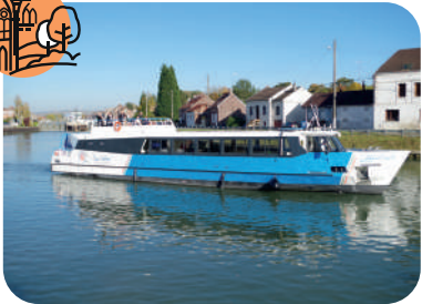
Mise en service du bateau l'Escapade (2015)