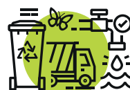
DEVENIR EXEMPLAIRE POUR L'ENVIRONNEMENT