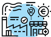
FAVORISER LA TRANSITION ÉCONOMIQUE DU TERRITOIRE