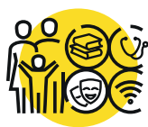
SOUTENIR ET RENFORCER LES POLITIQUES DE SOLIDARITÉ