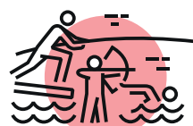
ENCOURAGER LES PRATIQUES SPORTIVES COMME VECTEUR DE COHÉSION