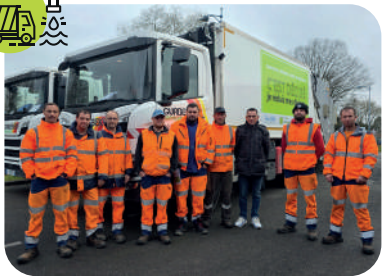
Lancement de la collecte des déchets alimentaires (2026)

collecte et traitement des déchets des ménages et déchets assimilés