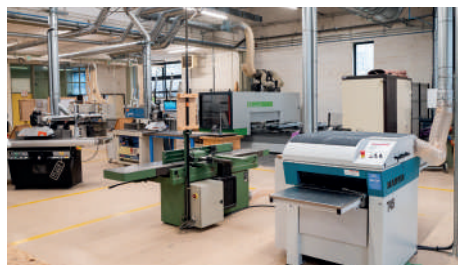
Atelier de menuiserie