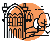
METTRE EN VALEUR LES ESPACES NATURELS & LE PATRIMOINE