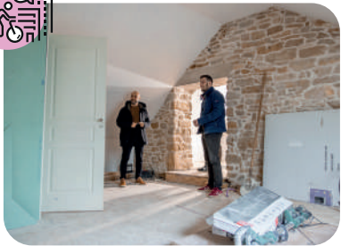
Opération d'Amélioration de l'Habitat (depuis 1997)