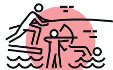
ENCOURAGER LES PRATIQUES SPORTIVES COMME VECTEUR DE COHÉSION