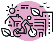
AMÉNAGER UN TERRITOIRE ÉQUILIBRÉ & DURABLE