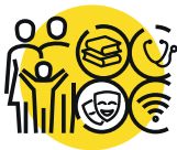
SOUTENIR ET RENFORCER LES POLITIQUES DE SOLIDARITÉ