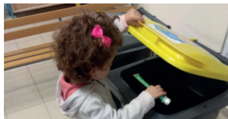
Animation scolaire tri