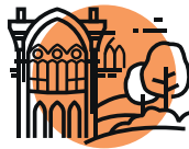
METTRE EN VALEUR LES ESPACES NATURELS & LE PATRIMOINE