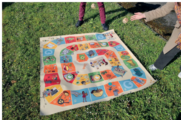
Jeu « Gaspiral » conçu par l'association Pro-portion